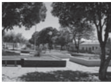
Praça do Brejo do Amparo

Eu tinha nove anos quando saí a primeira peça minha. Pegava a faca e começava a cortar. Meu