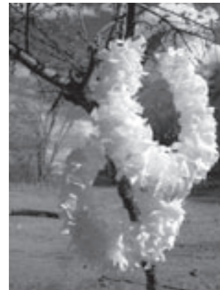
Arcos de São Gonçalo. Localidade de Olhos d'Água, Cônego Marinho

um ou outro porco mantido pela família para o consumo doméstico. O excedente da produção, em ano pródigo, é vendido. Mais recentemente, passou a plantar mamona, cuja semente é comercializada em Januária. O dinheiro, assegura, lhe permite que viva “no cantinho da gente. A gente vive feliz”.