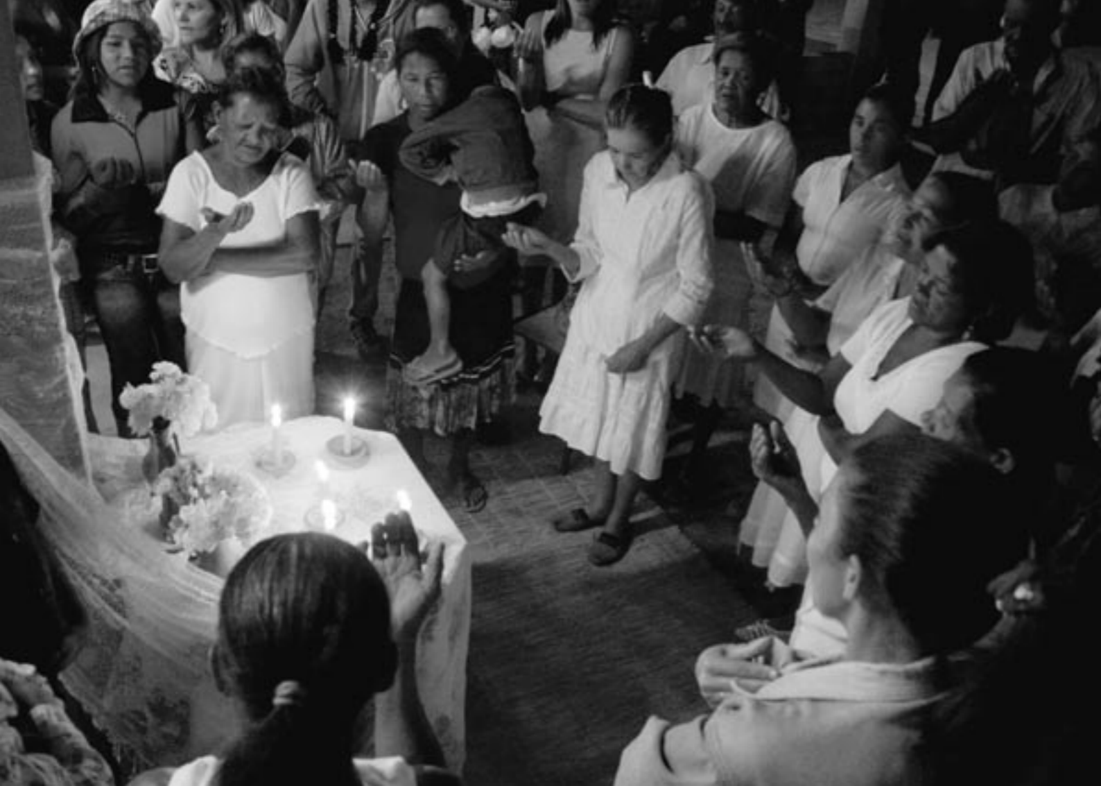
Reza para São Gonçalo, Galpão do Candeal, Cônego Marinho, ago/2008