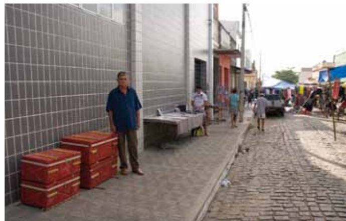
na feira de sábado