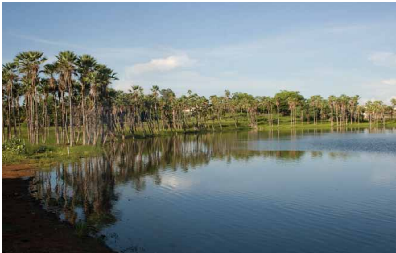
Lagoa de Apodi