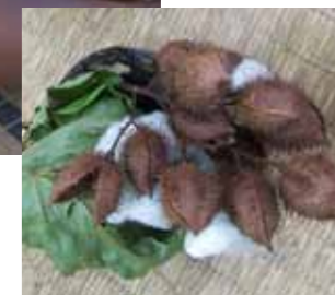
matérias-primas dos pigmentos vegetais