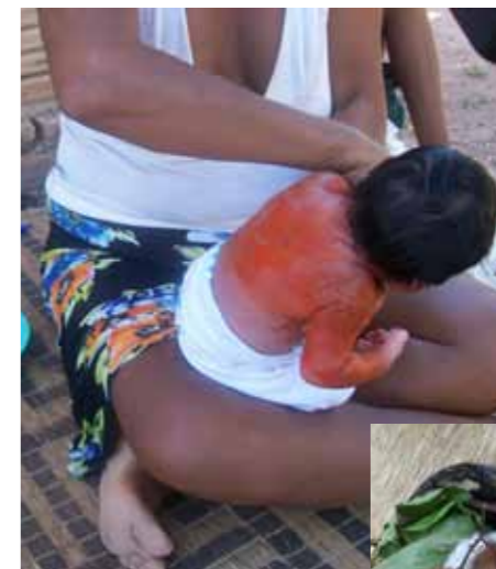
O primeiro banho do bebê (Santa Isabel do Morro)

partir da mistura da tinta do jenipapo com fuligem de carvão. Hoje, devido ao preconceito da população das cidades ribeirinhas, os jovens preferem apenas desenhar os dois círculos na época dos rituais.