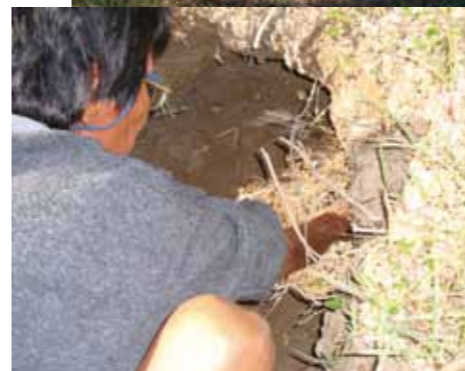
barreiro na aldeia Santa Isabel do Morro