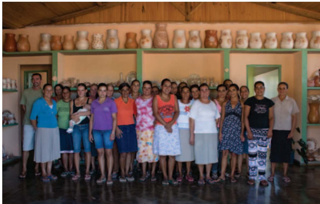
Associação dos Artesãos de Coqueiro Campo

Hoje, cada associação conta com um espaço bem estruturado, utilizado principalmente para a comercialização da produção artesanal, realização de reuniões, além da organização e feitura de embalagens para a participação em feiras ou para encomendas. Embora algumas artesãs recebam encomendas diretamente em suas casas, o escoamento da produção é viabilizado sobretudo por meio dessas associações, onde as mais diversas peças ficam expostas em prateleiras, reservadas para cada uma das associadas.