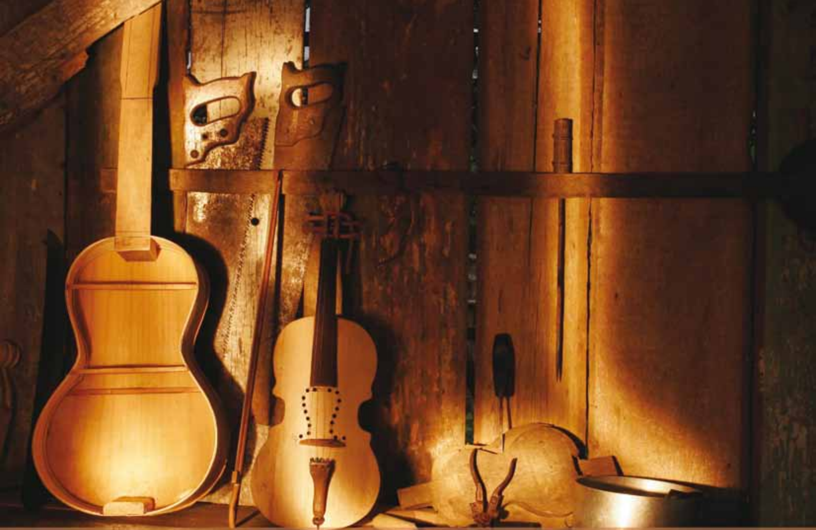
Instrumentos musicais do fandango caiçara