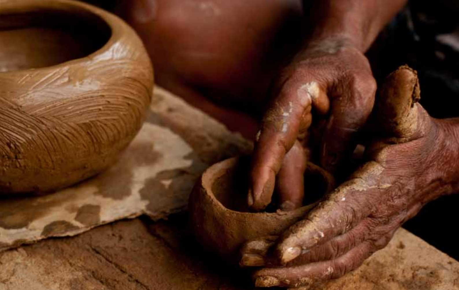
Cerâmica de São Gonçalo Beira Rio