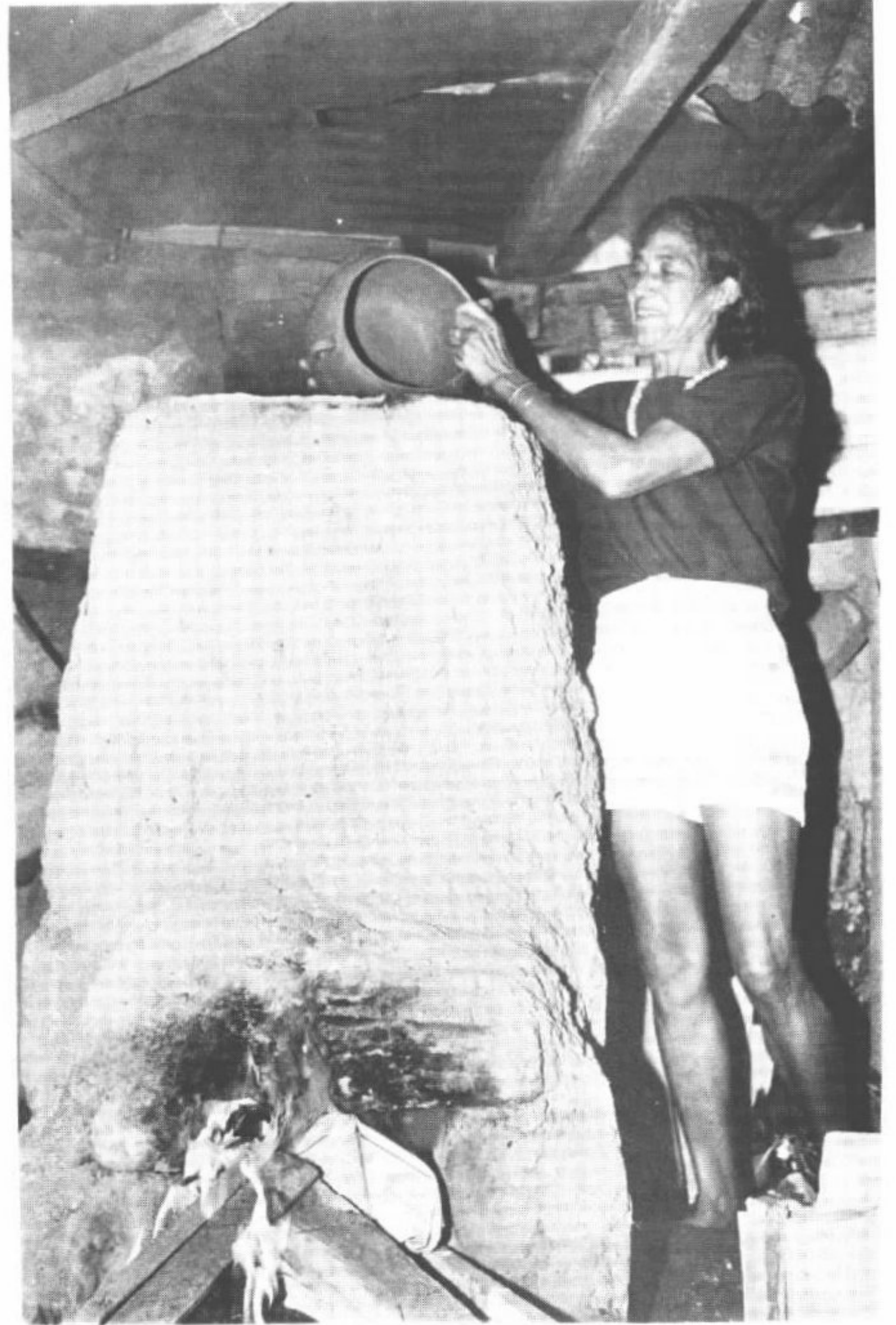
As duas ceramistas e seus fornos, construídos com o mesmo empenho com que modelam suas peças.