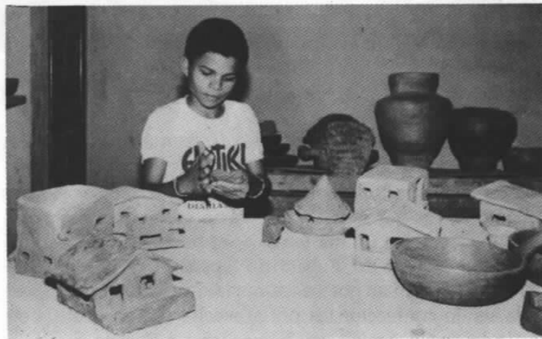
Moldando o barro para fazer suas maquetes.